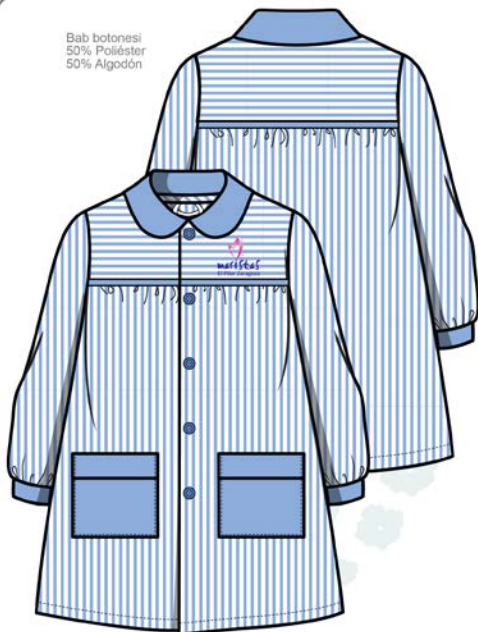
Babi botonesi 50% Poliéster 50% Algodón